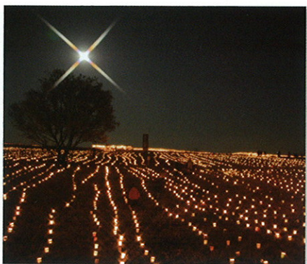
「やわらかな夜」~14万人のキャンドルイルミネーション~